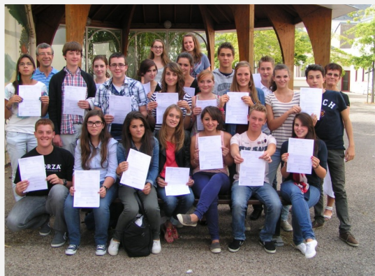
Promotion Beatson (2014)

Une section reconnue par le Rectorat de Nantes (la seule du département) et qui permet aux jeunes, en Terminale, de la prendre comme option (les points au-dessus de la moyenne comptent pour le diplôme) et de valider une mention section européenne anglais qui sera écrite sur leur original de baccalauréat.